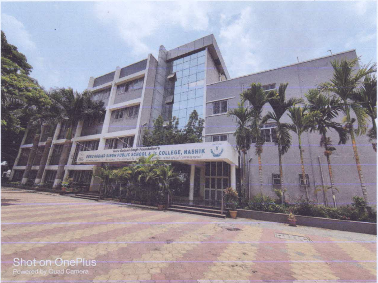
Shot on OnePlus Powered by Quad Camera